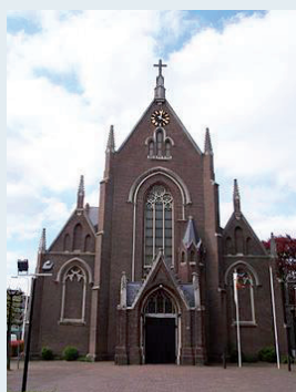
Mariakerk aan de Schans

Wij zijn ons 9e lustrum begonnen met een zondagsviering op 2 april in de Mariakerk aan de Schans te Tilburg, waar we een intentie hebben laten doen voor alle overleden leden en partners van onze vereniging.