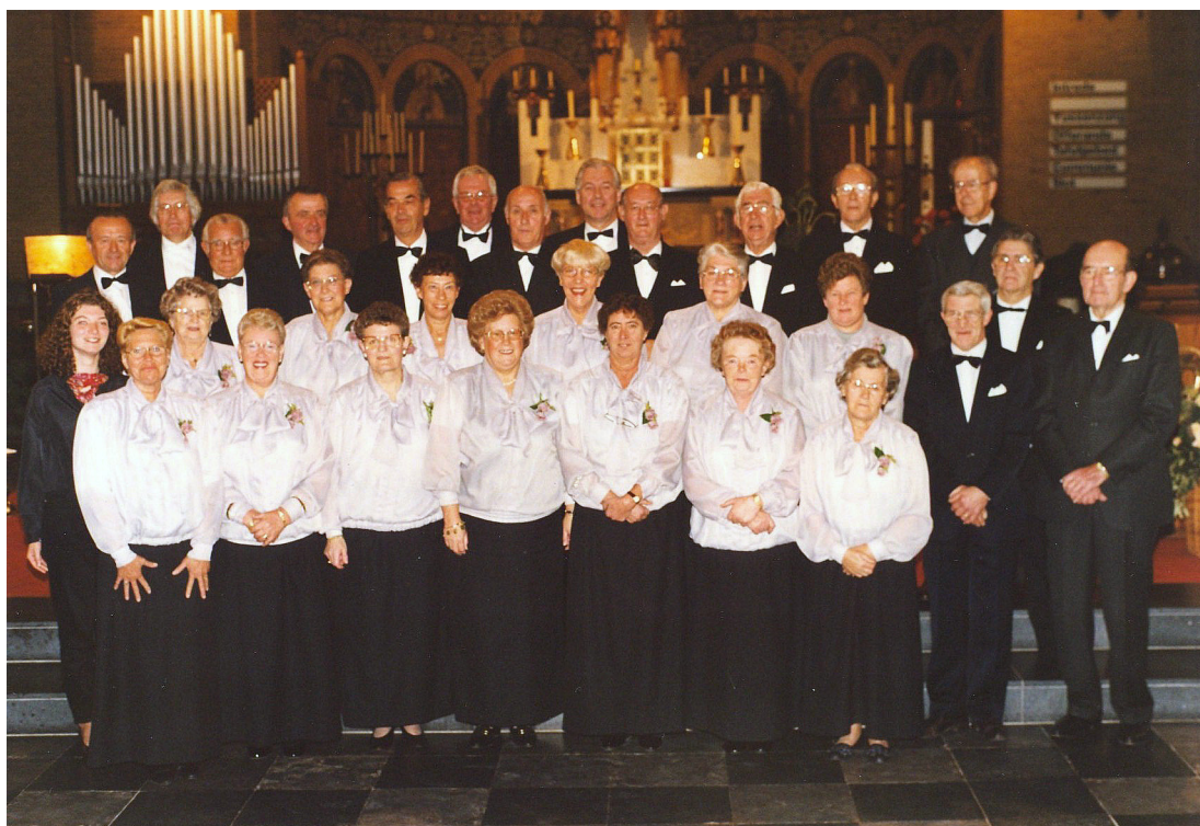
Foto tijdens het 25 jarig jubileum van Resurrexit, 1997

Het is daarom niet verwonderlijk dat verscheidene leden, inmiddels boven de tachtig en negentig, die deze succesvolle tijd nog meegemaakt hebben, nu met weemoed terugkijken op deze glorierijke periode van Resurrexit.