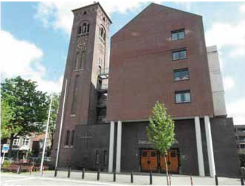
Zalige Petrus Donderskerk, Enschotsestraat, Tilburg