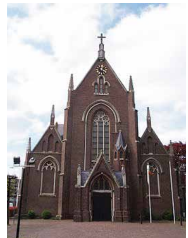
Mariakerk aan de Schans, Tilburg