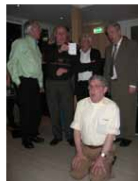
Op de knieën voor "Het eerste meisje van de zangvereniging"