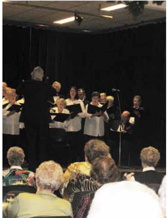
Resurrexit in uniform tijdens het kerstconcert in 2004 dames: zwarte rok en witte blouse; heren: zwart kostuum witte overhemd en stropdas