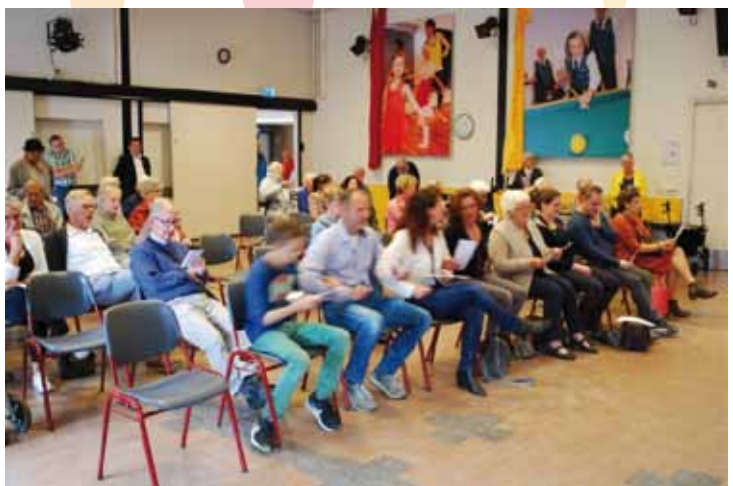
Bezoekers Open Dag Baselaer