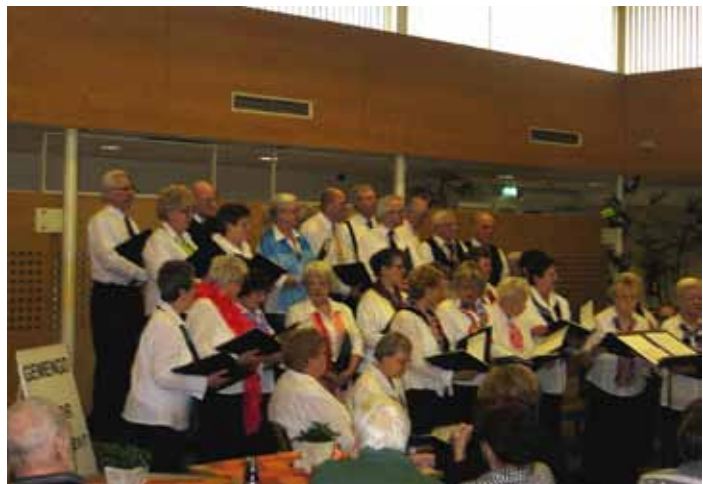
Uitvoering in 2009 in St. Jozefzorg