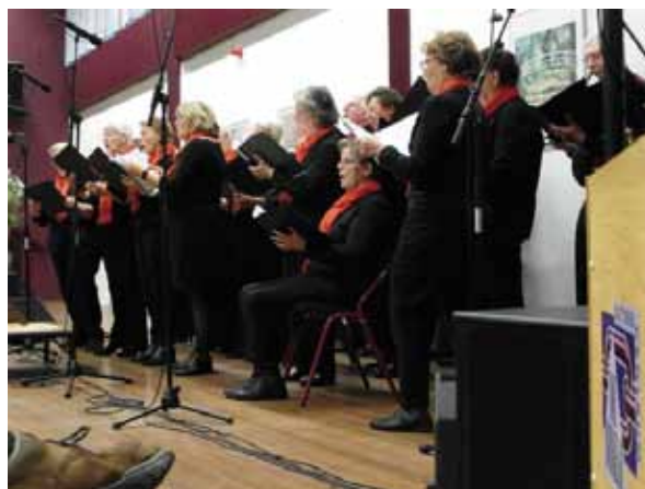
Resurrexit op FTZ-seniorendag 2017

Aangezien de 'Nieuwe Schalm' in het Koningsoord in Berkel-Enschot nog niet geschikt was om daar korenfestivals of korendagen te houden, werd deze gehouden in Ontmoetingscentrum het Plein, te Udenhout.