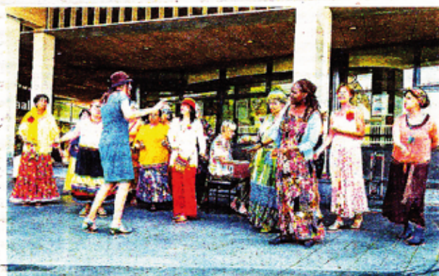
Kleurrijke Mama's Tilburg