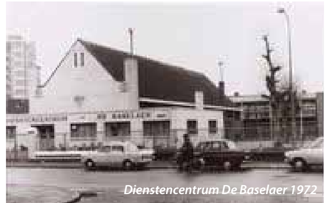
Dienstencentrum De Baselaer 1972

Daar in dat klein wijkgebouw in de Hoefstraat, zijn wij als zangers gelukkig en tevreë Daar in dat klein wijkgebouw in de Hoefstraat, daar telt plezier en muziek heel erg mee.