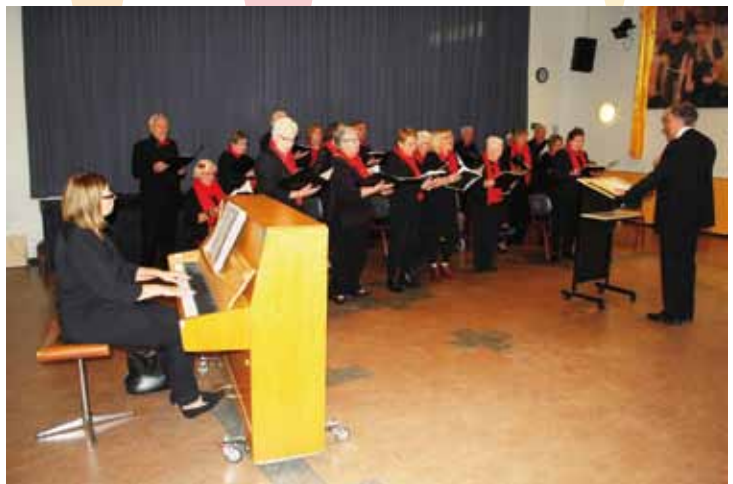
Gemengd Koor Resurrexit

Men genoot ook van de korte uitvoeringen, van de Koninklijke Harmonie Orpheus en Gemengd Koor Resurrexit, de verhalenrij die tussen de bedrijven door "de Baselaer verbeeldt". Alles vond plaats in de grote zaal van de Baselaer en ook de sketches de presentatie van 'De twee motten' van wijlen Tom Manders viel bij de aanwezige bezoekers in de smaak.