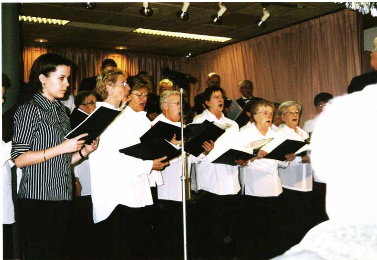
Kerstconcert 2008. Resurrexit te gast bij Gemengd Koor Les Amis, dat op 26-10 2008 haar 30e verjaardag vierde. Beide koren staan hier op het podium.