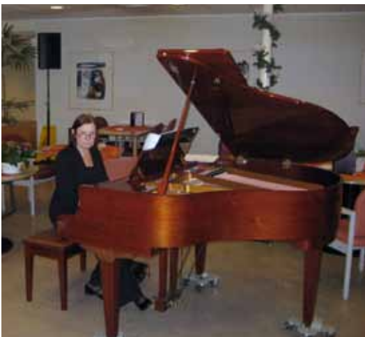
Cia de Backer: 2009 in St. Jozefzorg

In de repetities liet hij ook van zich horen en wat we wel wat irritant vonden was, dat hij stampvoetend liet horen welke maat we moesten houden. Hij had zijn disciplinaire regels al aan het koor kenbaar gemaakt. Hij had ook aangegeven, dat hij slechts voor korte tijd de dirigeerstok in handen wilde nemen.