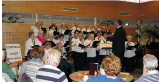
Uitvoering in 2009 in St. Jozefzorg