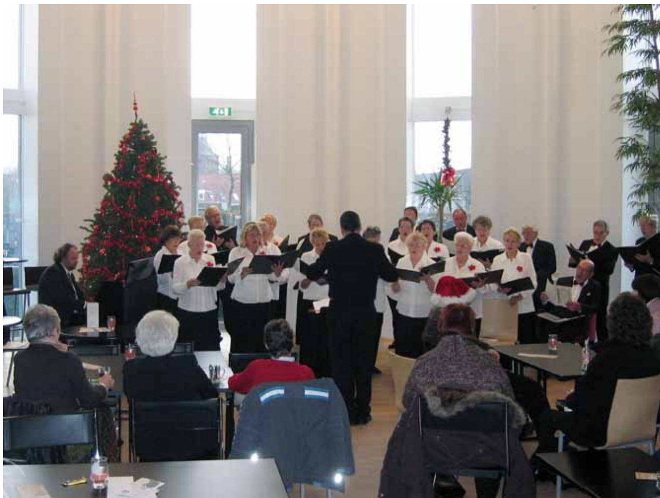
Kerstconcert in wijkcentrum 'De Poorten', Tilburg