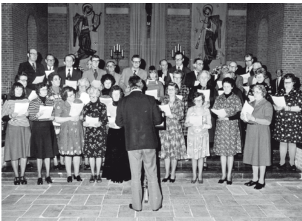
Resurrexit 1975 (kerk St. Antonius van Padua)

Het was 'n leuke dag, waar-bij er door de organisatie van de Baselaer veel werk is verricht om alles in goede banen te leiden. Menigeen liet de klaargemaakte hapjes goed smaken.