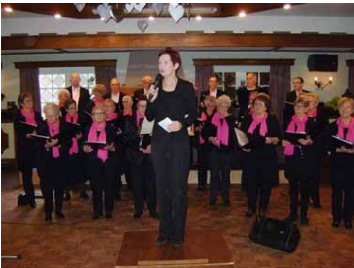
Zangkoor Crescendo, Moergestel,