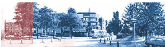
De Bijsterstede, Tilburg