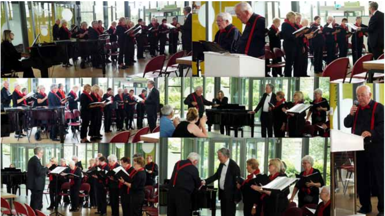
Collage muziekmarathon 2018