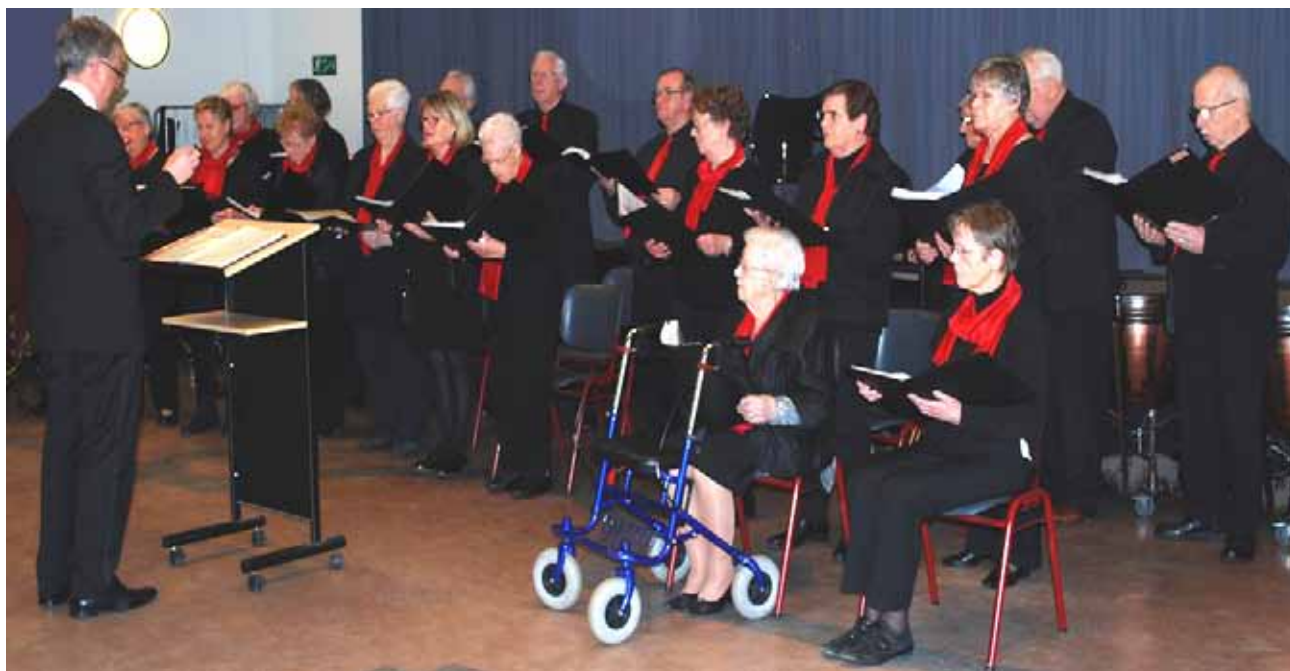
Gemengd Koor Resurrexit, 2018.