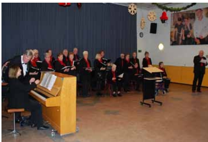
Buurtbühne -Nieuwjaarsconcert K.H. Orpheus i.s.m. Gemengd Koor Resurrexit 14-1-2018