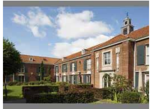
St. Jozefzorg, Tilburg