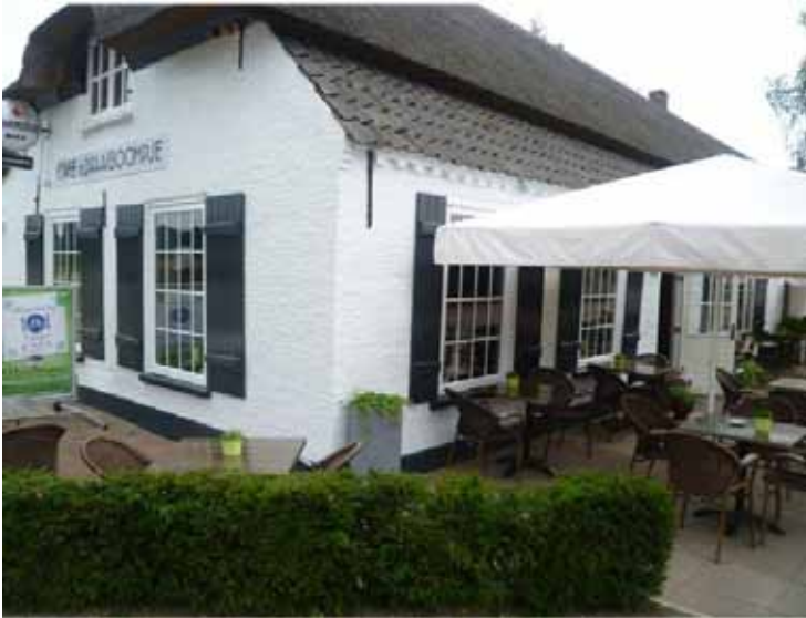
Het Draaiboompje, Moergestel