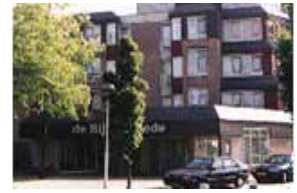
Zorgcentrum-de Reyshoeve Zorgcentrum-De Bijsterstede

Resurrexit kreeg overal een warm onthaal met haar nostalgische uitvoeringen in de zorgcentra en dat was ook het geval bij de Bijsterstede en bij de Reyshoeve. waar we een wat kleinere recreatieruimte tot onze beschikking hadden dan in de Bijsterstede, maar ook sfeervol.