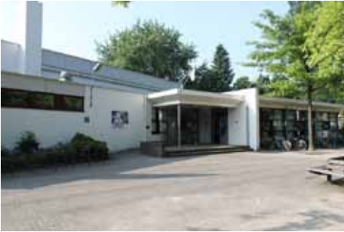
De Schalm Berkel-Enschot

Hij was daarbij ook een man die zijn sociale contacten met het koor hoog in het vaandel had staan. En of het nu om een fietstocht, om een Driekoningen zingen of een S.A.K. concert ging, hij was van de partij, stond er en wist het koor in de richting te stuwen die hij voor ogen had.