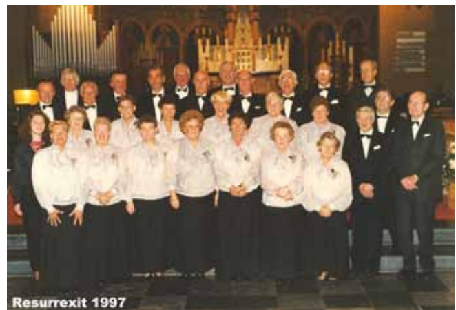
Resurrexit 1997 (kerk St. Antonius van Padua)