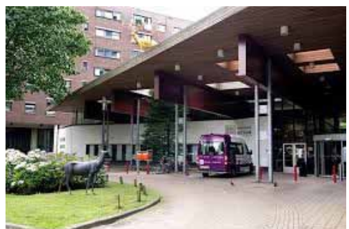
Het Laar, Tilburg